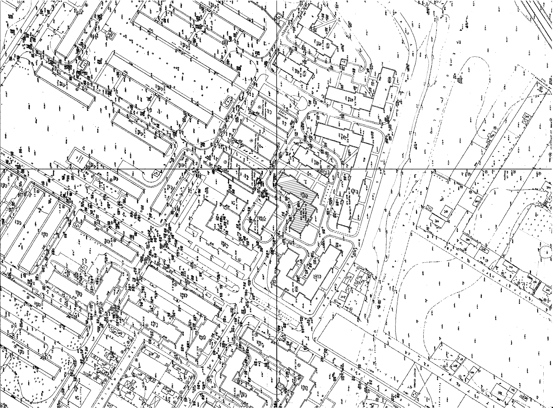
PLAN DE SITUATIE, SCARA 1:2000